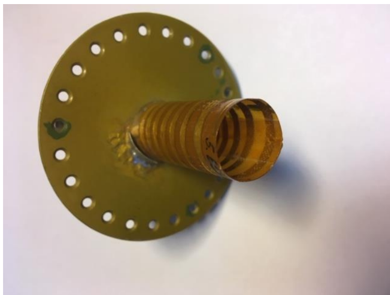
Рисунок 3. Спиральный излучатель С-диапазона

Восьми-лучевая приемная АФАР S-диапазона для низколетящего космического аппарата построена на турникетных излучателях с круговой поляризацией, реализованных печатным способом на текстолите и представленных на рис. 4.