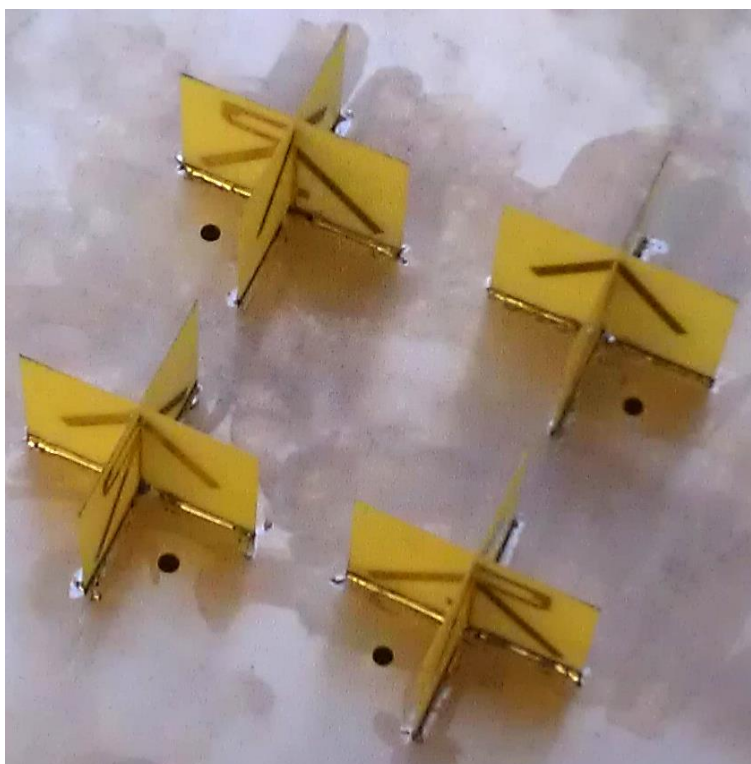
Рисунок 4. Турникетные излучатели S-диапазона

Восьми-лучевая приемная АФАР S-диапазона для низколетящего космического аппарата построена на турникетных излучателях с круговой поляризацией, реализованных печатным способом на текстолите и представленных на рис. 4.